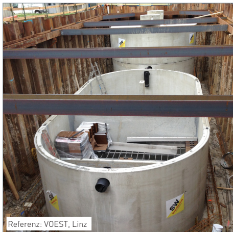
Referenz: VOEST, Linz