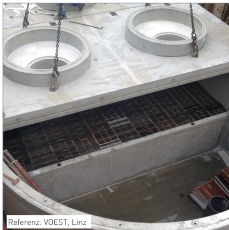
Referenz: VOEST, Linz